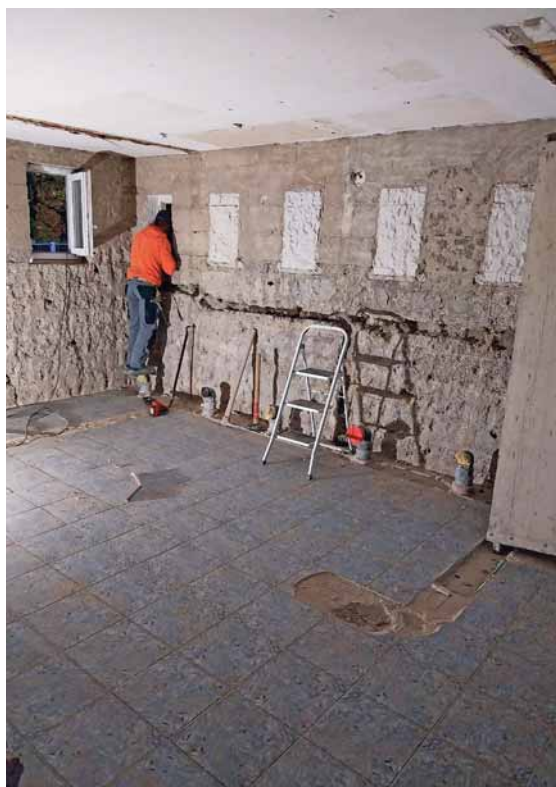
Neue behindertengerechte WC-Anlagen, ein Wickelbereich mit Dusche sind zwei der Baumaßnahmen, die in der Kita Krumbach geplant sind.

Die Kosten der Maßnahmen belaufen sich auf rund 732.000 Euro. Rund 40 Prozent davon, 246.000 Euro, werden im Rahmen des Entwicklungsprogramms Ländlicher Raum (ELR) Baden-Württemberg gefördert.