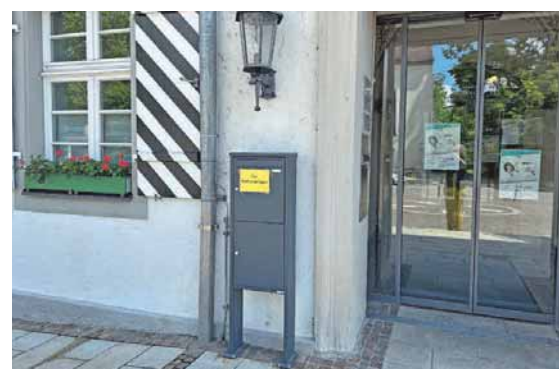
Vor dem Rathaus Tettang werden zwei Briefkästen aufgestellt, in die Briefwählerinnen und -wähler ihre ausgefüllten Wahlunterlagen werfen können.

Am 23. Februar 2025 wird – ein halbes Jahr vor dem vorgesehenen Wahltermin – ein neuer Bundestag gewählt. Dies bedeutet auch verkürzte Fristen bei der Briefwahl. Die Stadt Tettang empfiehlt deshalb, direkt am Wahltag im Wahllokal zu wählen. Briefwählenden rät die Stadtverwaltung, in der Wahlkabine im Bürgerbüro zu wählen oder die ausgefüllten Unterlagen in die beiden Briefkästen vor dem Rathaus zu werfen.