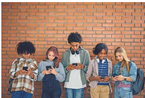
Plattformen wie Instagram, TikTok und Snapchat gehören für viele Kinder und Jugendliche zum Alltag.

Veranstaltet wird der Vortrag vom Landratsamt Bodenseekreis, der Kommunalen Kriminalprävention Bodenseekreis e. V. und dem Polizeipräsidium Ravensburg.