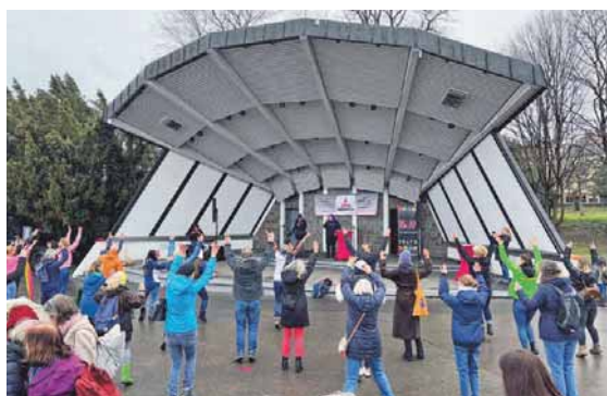
Bereits 2024 wurde an der Uferpromenade mit rund 150 Menschen getanzt, um ein Zeichen gegen Gewalt an Frauen und Mädchen zu setzen.

„Rise for empathy“: So heißt das Motto der diesjährigen Aktion „One Billion Rising“. Ins Leben gerufen wurde „One Billion Rising“ von der New Yorker Künstlerin Eve Ensler. Über 200 Länder weltweit machen mit. Die Protestaktion richtet sich gegen jegliche Formen der Gewalt: sexuelle und körperliche Gewalt sowie psychische und strukturelle. Deshalb gehen weltweit Frauen – und auch solidarische Männer – auf die Straße und fordern: Schluss mit der Gewalt gegen Frauen.