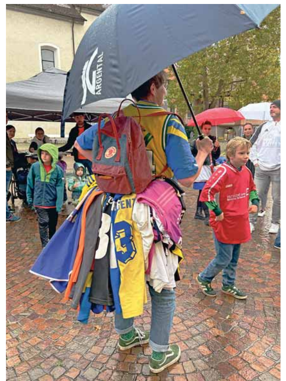
...und hatte auch noch Dutzende weitere im Schlepptau.