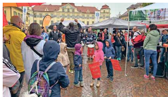
Hunderte Tettangerinnen und Tettanger kamen zum Zählen ihrer Trikots auf den Montfortplatz.

Tettang hat am Dienstag bewiesen, was es gemeinsam alles stemmen kann! Wir danken allen Teilnehmerinnen und Teilnehmern, den Gemeinderäten, Unternehmen, Geschäften, Kitas, Schulen, Ehrenamtlichen und allen voran den Vereinen, dem Fanfarenzug Montfort, Tettang erleben e. V. und den Rathausmitarbeiterinnen und -mitarbeitern, die die Aktion tatkräftig unterstützt haben!