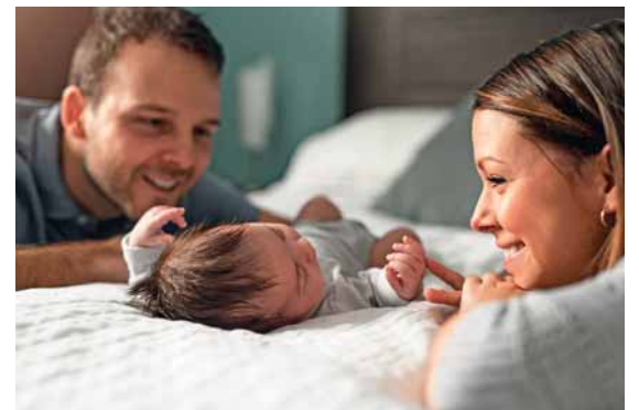
Mit der Geburt eines Babys verändert sich vieles und es kommen viele Fragen auf, die im Online-Vortrag beantwortet werden.

Die 21 Familientreffs im Bodenseekreis veranstalten jährlich mehr als 100 Vorträge zu familienrelevanten Themen. Alle Informationen, weitere Vorträge und Online-Angebote für Eltern, Familien und Erziehende sowie die Datenschutzerklärung gibt es unter www.bodenseekreis.de/soziales-gesundheit/familie-kinder/familientreffs/