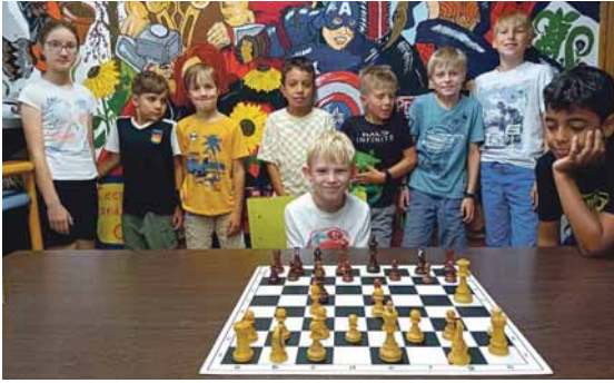
Die (fortgeschrittenen) Schachkids