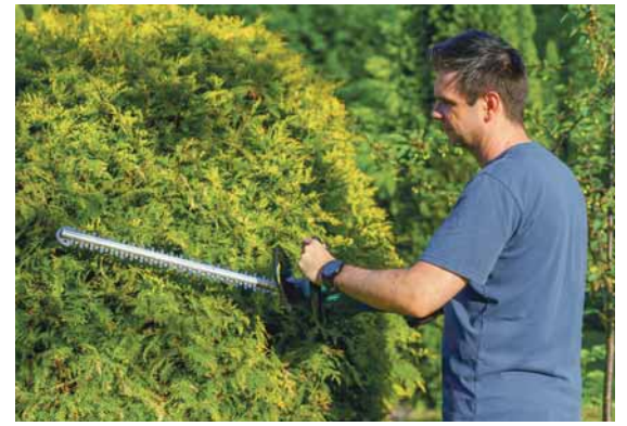
Dann kann es nur heißen: „Bitte zurückschneiden!“

Hecken, Bäume und andere Pflanzen beleben und verschönern das Ortsbild und tragen zur Verbesserung der Lebensräume für Mensch und Tier bei. Werden sie aber nicht beobachtet und, wenn nötig zurückgeschnitten, entstehen Gefahrenquellen. Beim Ordnungsamt eingehende Hinweise und Beschwerden sowie selbst durchgeführte Ortsbesichtigungen zeigen, dass an Kreuzungen, Einmündungen sowie Fuß- und Radwegen immer wieder Behinderungen durch überhängende Äste und zu breit oder zu hoch wachsende Hecken bestehen.