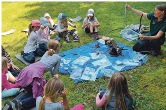
Die Kinder lauschten aufmerksam der Waldpädagogin, die ihnen spannende Fakten und Wissenswertes über den Wald und seine Bewohner vermittelte.

Die Zirkus-Akademie sorgte mit einem Poi-Workshop für Begeisterung. Eine Waldpädagogin hatte viel Wissenswertes im Gepäck und der Forst Baden-Württemberg fällte extra für die Kinder einen Baum im Wald, der noch bis in den Herbst als besonderes Andenken an den Ort der Ferienbetreuung stehen bleibt.