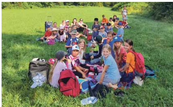
Im Rahmen einer Wanderung machten die Kinder ein Picknick in der freien Natur.

Das Essen wurde im Wald von den Betreuern zubereitet und einmal pro Woche gab es leckere Pizza vom Italiener.