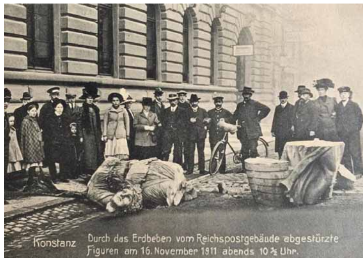
Postkarte Stadtarchiv Konstanz

Das stärkste neuzeitliche Erdbeben auf deutschem Boden ereignete sich am 16. November 1911. Das Epizentrum lag bei Albstadt-Ebingen mit einer Magnitude von 6,1 auf der Richterskala. Es trat gegen 22:15 Uhr auf und richtete schwere Sachschäden in Süddeutschland an. Insgesamt waren 6.250 Gebäude betroffen, mit einer Schadenssumme von etwa 750.000 Mark. Das sieben Sekunden lange Beben war von Braunschweig bis in die Toskana spürbar. In Konstanz brach die Spitze des Münsterturms ab und die steinernen Statuen des Reichspostgebäudes fielen auf die Straße herab.