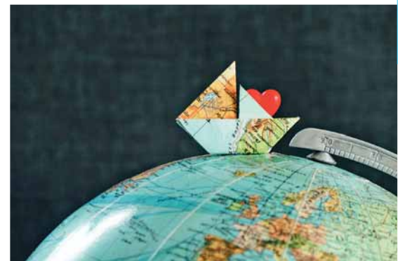
Eine kulinarische Weltreise führt von der Anlaufstelle für Bürgerengagement aus nach Afghanistan.

Hinweis: Am Dienstag, 1.10. gibt es eine weitere Weltreise mit der aus Rumänien stammenden Familie Stoica.