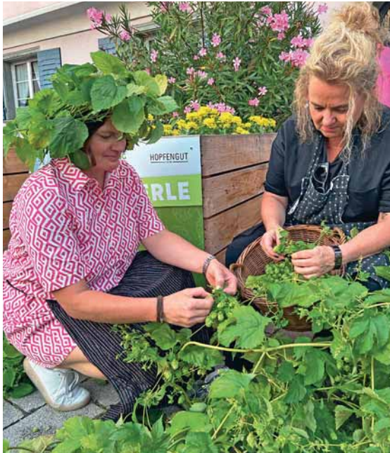
Fleißige Hopfenpflücker bei der Hopfenernte.

machten sich diejenigen ans Brocken, deren Hopfenpflanze auch Dolden gebildet hatte. Nach rund einer Stunde war das mit vereinten Kräften erledigt, wobei die Ausbeute doch sehr variierte.