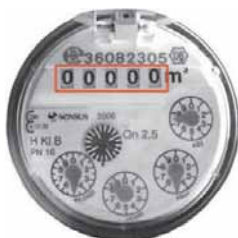
Ihre Wasserversorgung Unteres Schussental